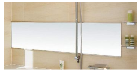
セミワイドミラー クリアシェルフ(2段)