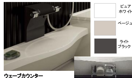
ウェーブカウンター