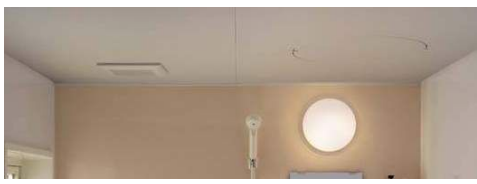
フラット天井 壁高さ 2150