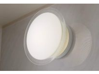
エクセレント照明 1灯 蛍光灯