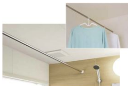
物干しバー1本・受具2組 付き